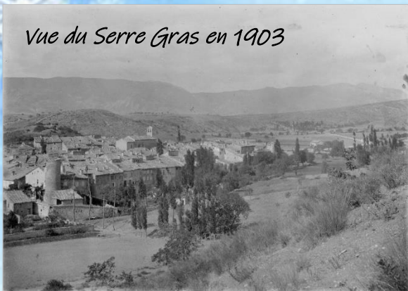
Vue du Serre Gras en 1903