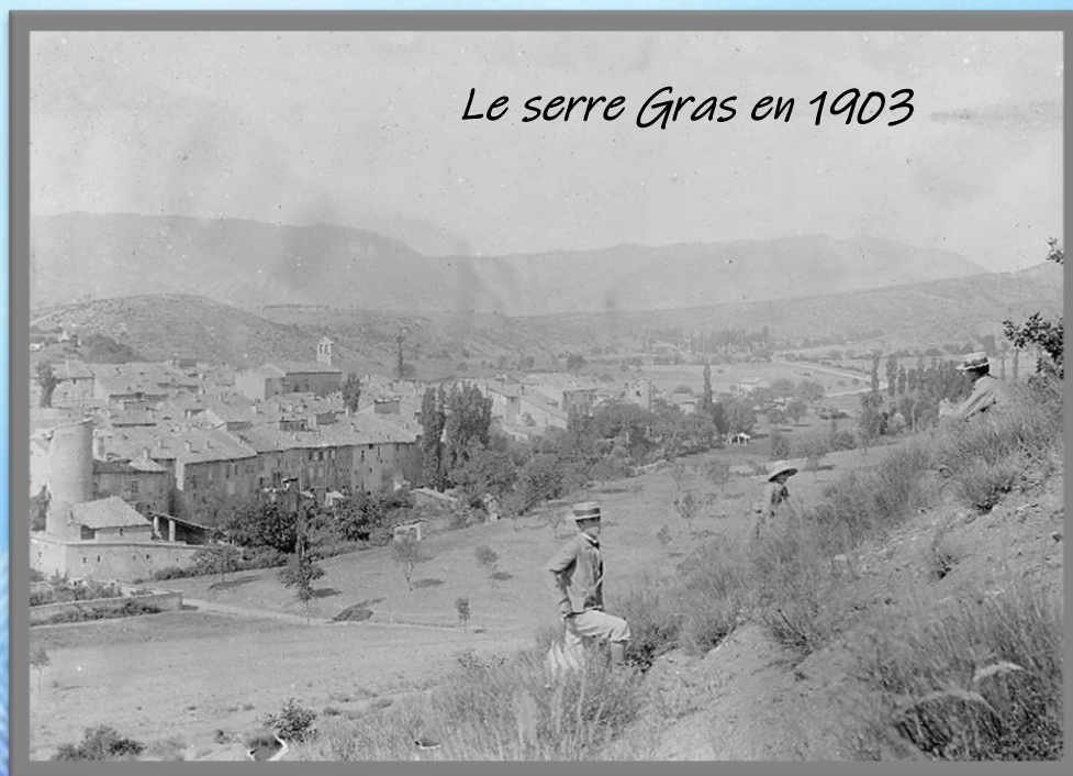
Le serre Gras en 1903