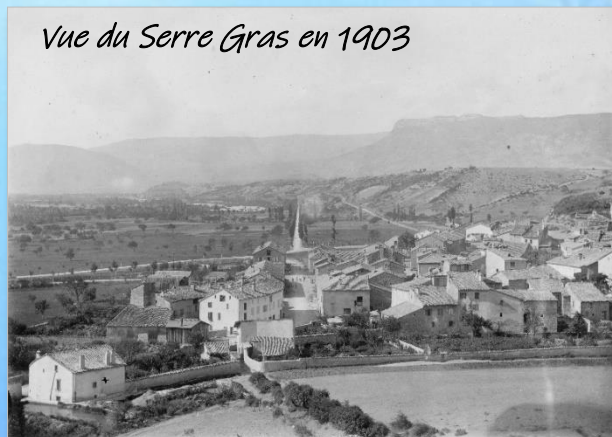
Vue du Serre Gras en 1903