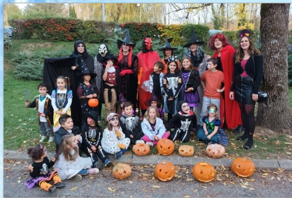
Halloween pour tous, organisée par l'équipe du Comité des Fêtes