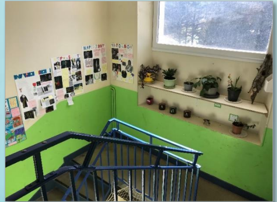
Sécurisation des escaliers, pose d'étagères et petits travaux d'aménagement au sein de l'école

Confection de barrières sur le pont d'accès au cimetière et au lotissement de la Tuilière