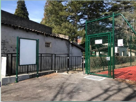
Création d'un portillon pour sécuriser le terrain de tennis

Pendant cette période hivernale, les agents des services techniques ont entrepris des travaux de rénovation et d'entretien.