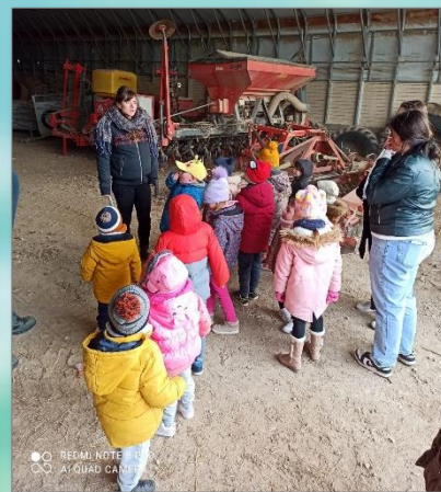
Sortie des maternelles au Moulin de la Beaume

D'ici là, nous continuons à travailler avec nos élèves !