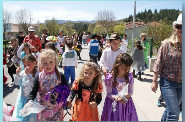
Le carnaval des petits escargots