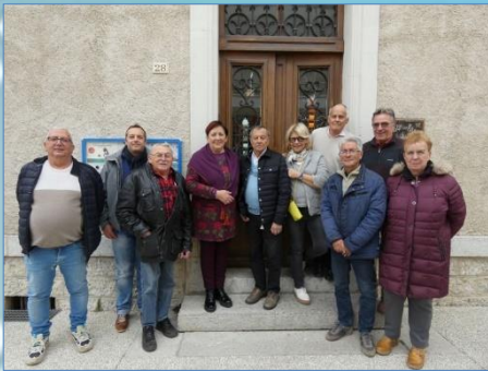
Les membres de l'ASPPB et les élus en présence des auteurs de l'ouvrage