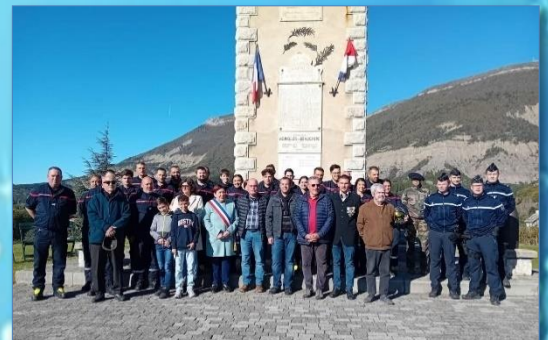
Cérémonie du 11 novembre au monument